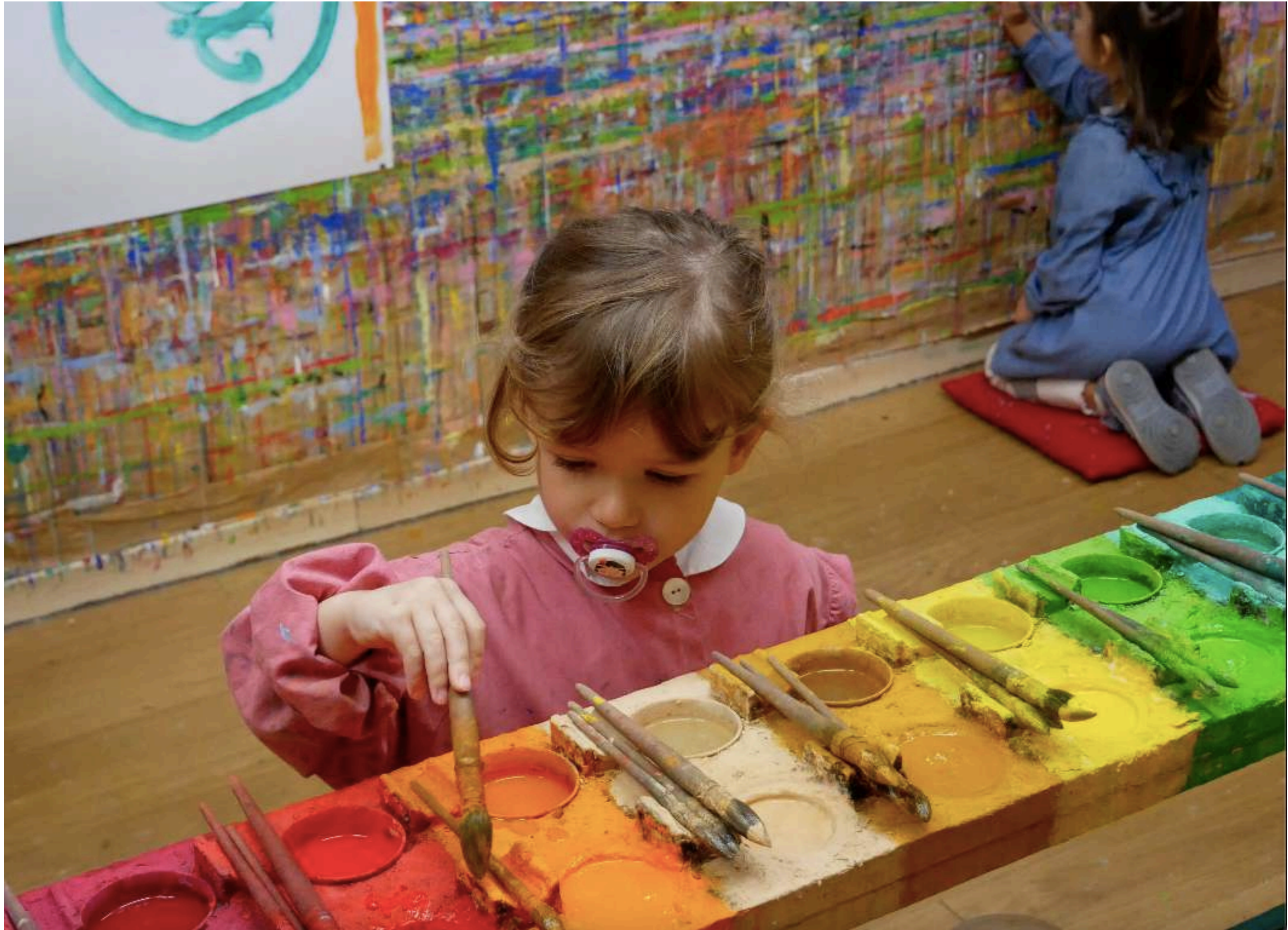
Les enfants sont libres de choisir les couleurs qu'ils souhaitent mettre sur leur toile. L'atelier dure entre 1h15 et 1h30.