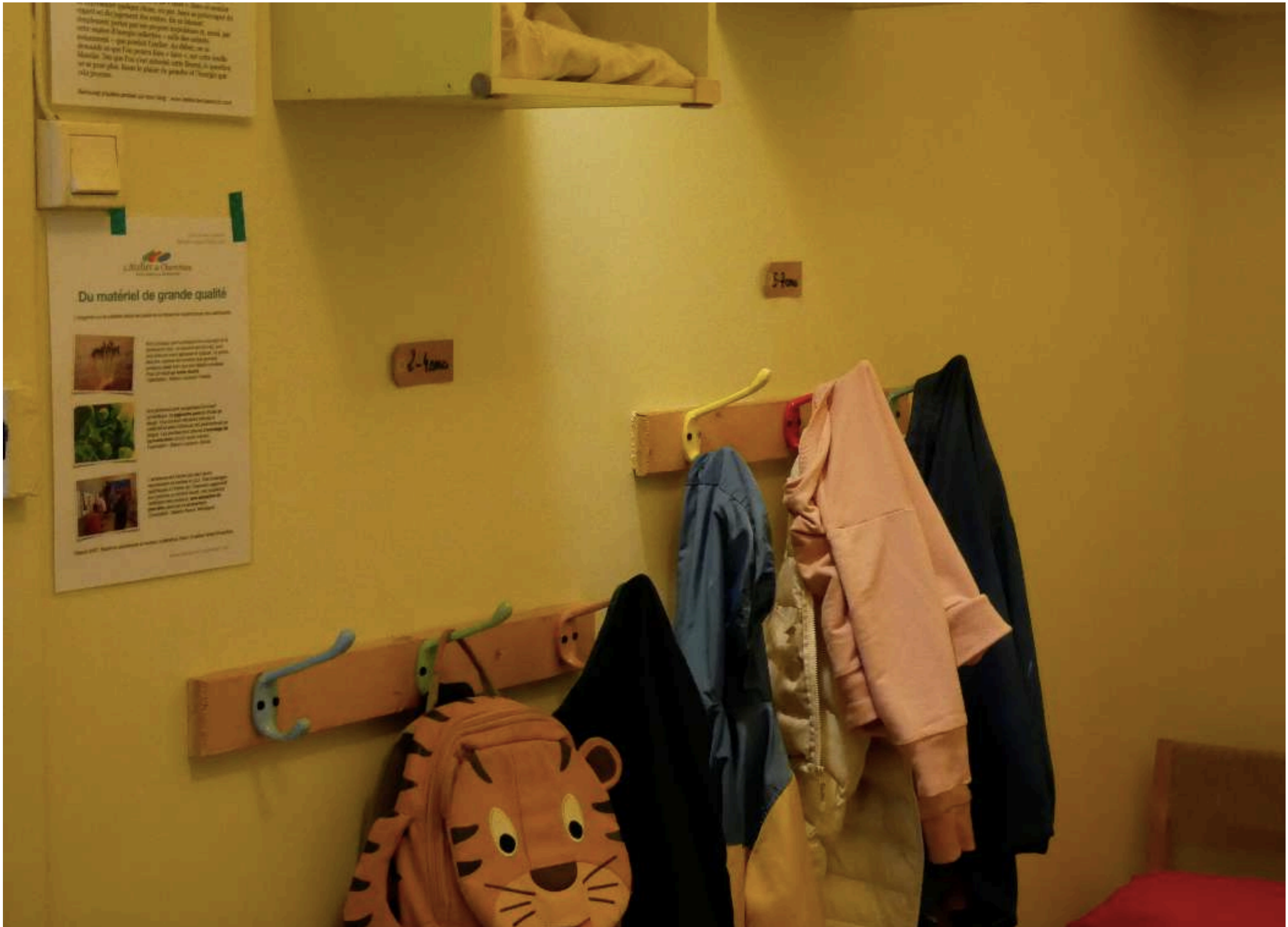
L'entrée de l'atelier.