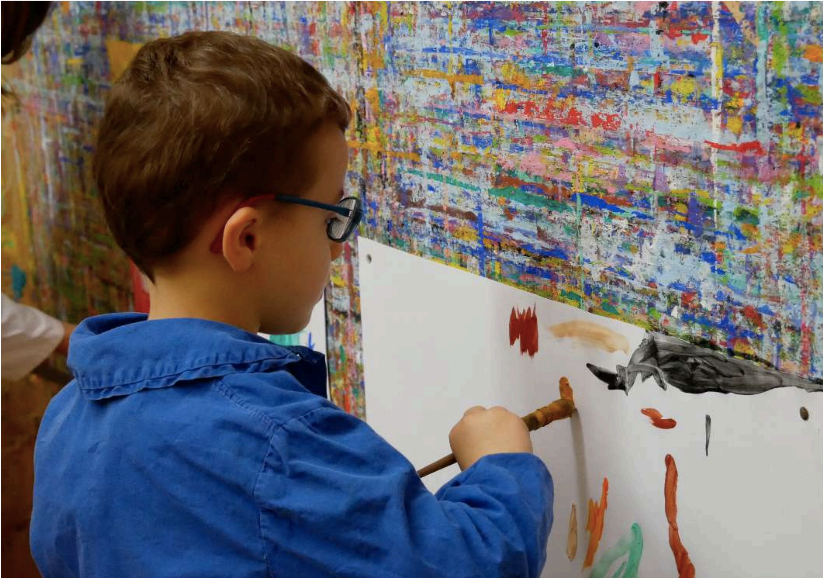
Le geste est libre sur la toile, les enfants dynamiques et remplis d'énergie diffusent leur peinture synonyme de leur expression de soi.