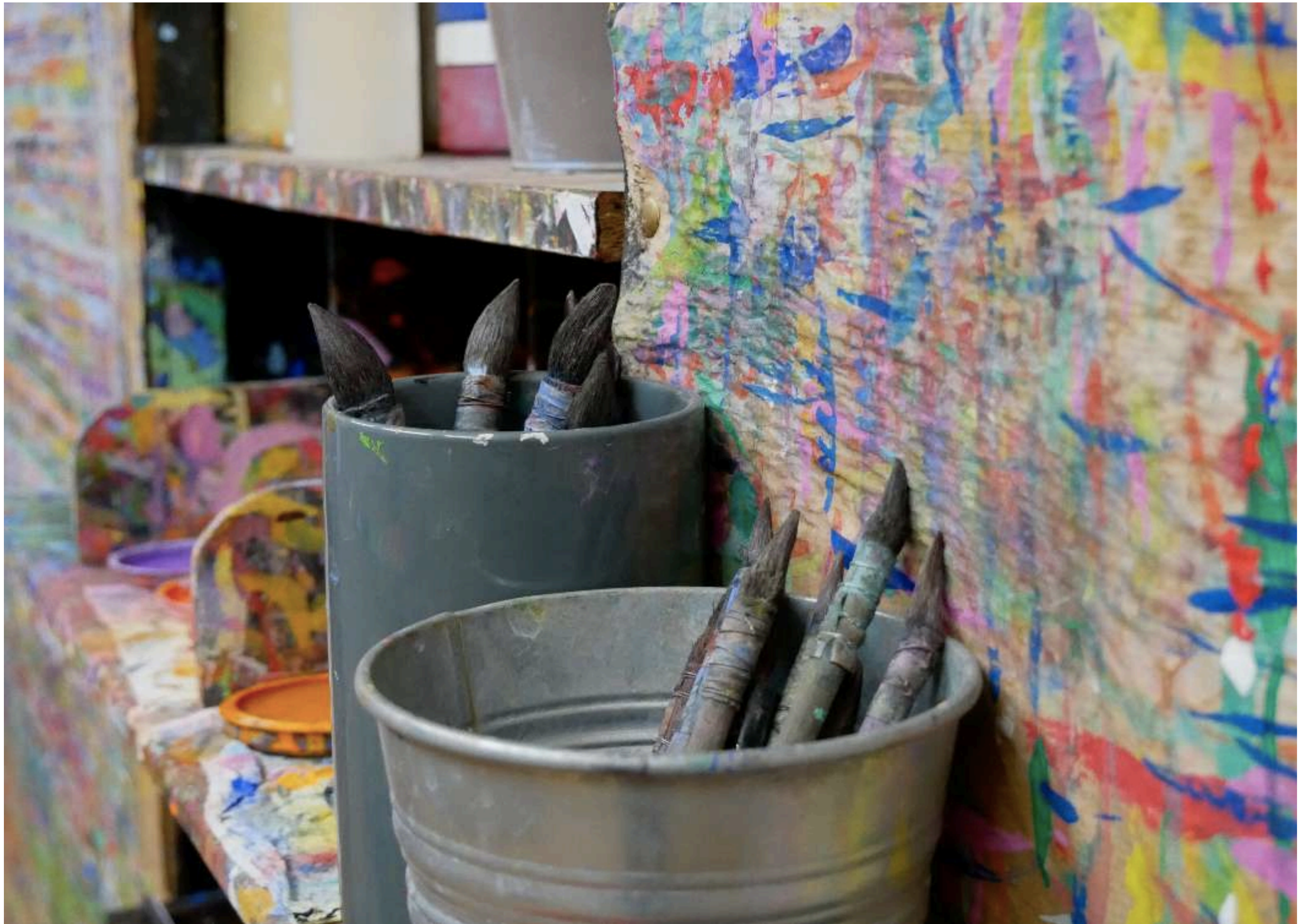
Du matériel est mis à disposition un peu partout dans l'atelier, les enfants s'en servent en toute autonomie.