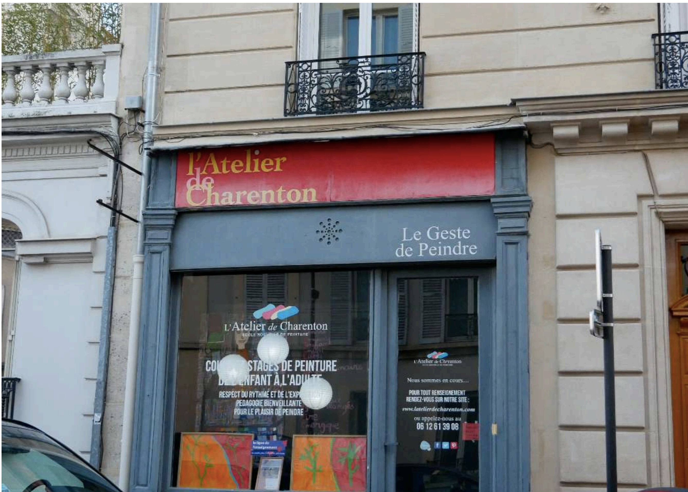
Extérieur de l'atelier de Charenton, l'endroit idéal pour y nicher l'atelier au coeur « de la plus belle rue de la ville » selon Sandrine